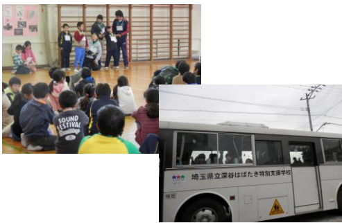
はばたきとの交流 (4年)