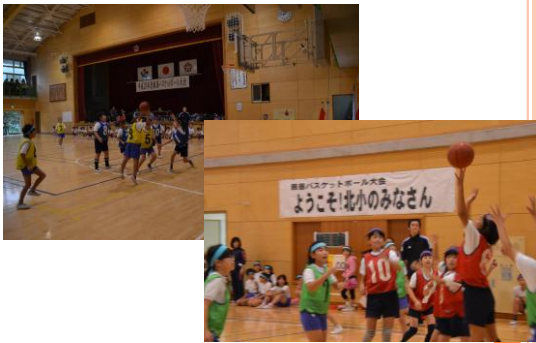
親善バスケット (5年)