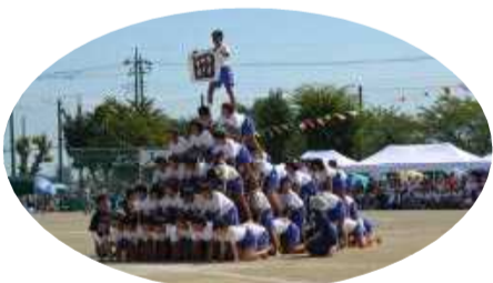
5・6年生 組体操「団結 ～Do it now!～」