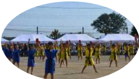
3・4年生 キッズよさこいな☆る☆こ