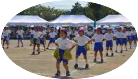
1・2年生 ダンス「学園天国」

そして、最後の片付けにご協力いただいた数多くの保護者の方々、役員としてお手伝いいただいた川本中学校陸上部のみなさんにも深く感謝申し上げます。ありがとうございました。