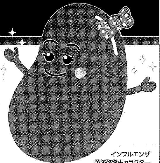
インフルエンザ 予防啓発キャラクター アズキちゃん

みんなの「かからない」、 「うつさない」という気持ちが、 インフルエンザの 予防にはとても大切です。