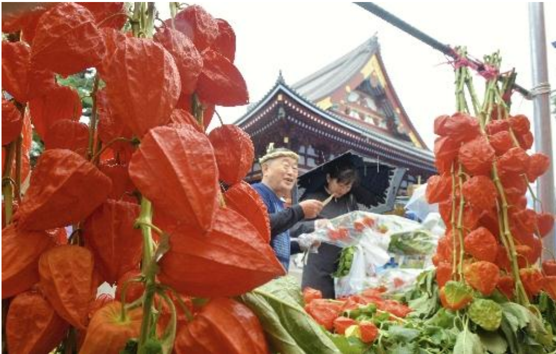
The Yomiuri Shimbun

◆東京・浅草の浅草寺で、恒例の「ほおずき市」が開かれ、雨の中、鮮やかなオレンジ色に染まったホオズキを買い求める客でにぎわいました。