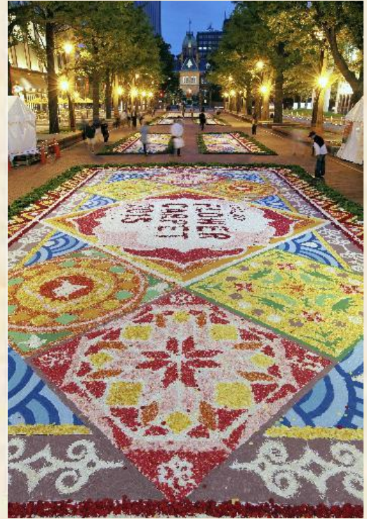
(2015年7月3日 読売中高生新聞より)

広場を埋め尽くす花のじゅうたん。札幌市の北海道庁赤れんが庁舎前にある広場で、バラや菊など約11万本分の花びらを使ったフラワーカーペットが登場した。カーペットの上を歩ける時間も設けられたが、もったいなくて、ついよけちゃいそう。