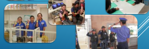
修学旅行(6月10日・11日)