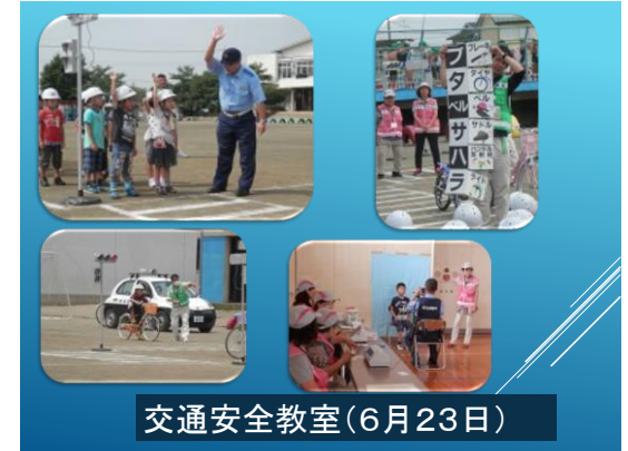
交通安全教室(6月23日)