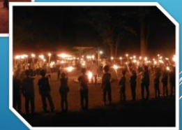
林間学校(5月28日・29日)