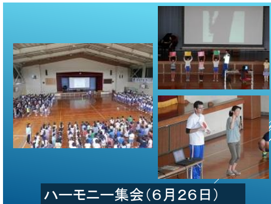
ハーモニー集会(6月26日)