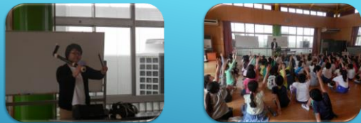
3年生リコーダー講習 (4月23日)