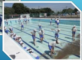
プールそうじ(6月4日)