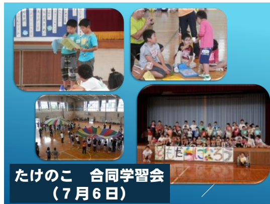
たけのこ 合同学習会 (7月6日)