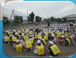
避難訓練・引き渡し(5月16日)