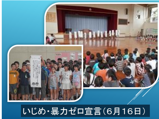
いじめ・暴力ゼロ宣言(6月16日)