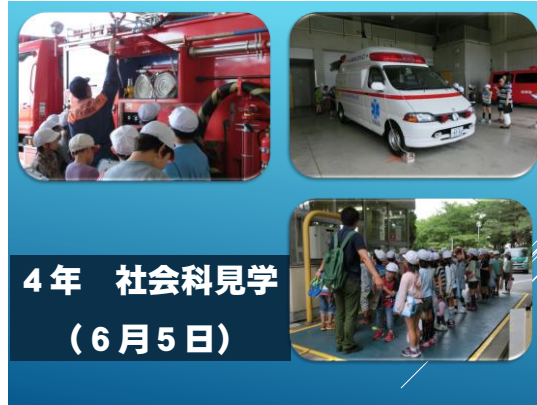
4年 社会科見学 (6月5日)